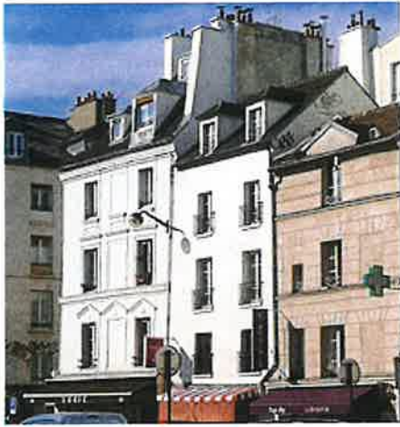
Le faubourg Saint-Antoine .

Quartier populaire situé à l'extérieur de la ville, l'actuel 11 e arrondissement s'est constitué autour de deux faubourgs de l'est parisien : le faubourg du Temple au nord, et le faubourg Saint-Antoine au sud. Le premier naît autour de l' enclos du Temple , et le second autour de l' abbaye Saint-Antoine-des-Champs .