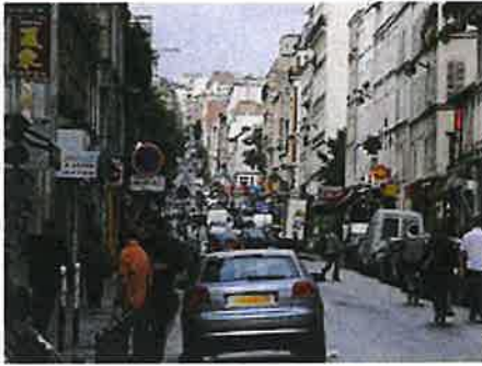
Vue de la rue Oberkampf.