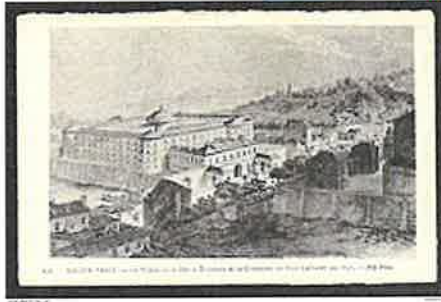
La prison de la Petite Roquette.

Article détaillé : Prisons de la Roquette .