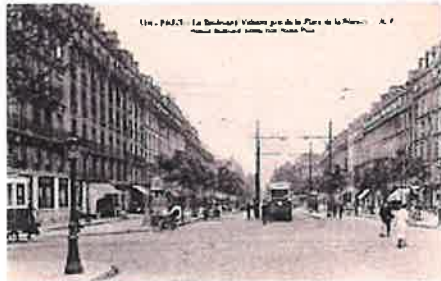
Le boulevard Voltaire au début du XX e siècle.

Les limites actuelles du 11 e arrondissement datent de 1860 , à la suite de la loi du 16 juin 1859 donnant lieu à un nouveau découpage de Paris en 20 arrondissements . Elles comprennent environ la moitié de l' ancien 8 e arrondissement (la moitié sud faisant partie de l'actuel 12 e arrondissement ).