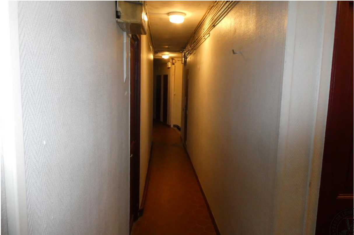
5 Couloir du 6 ème étage