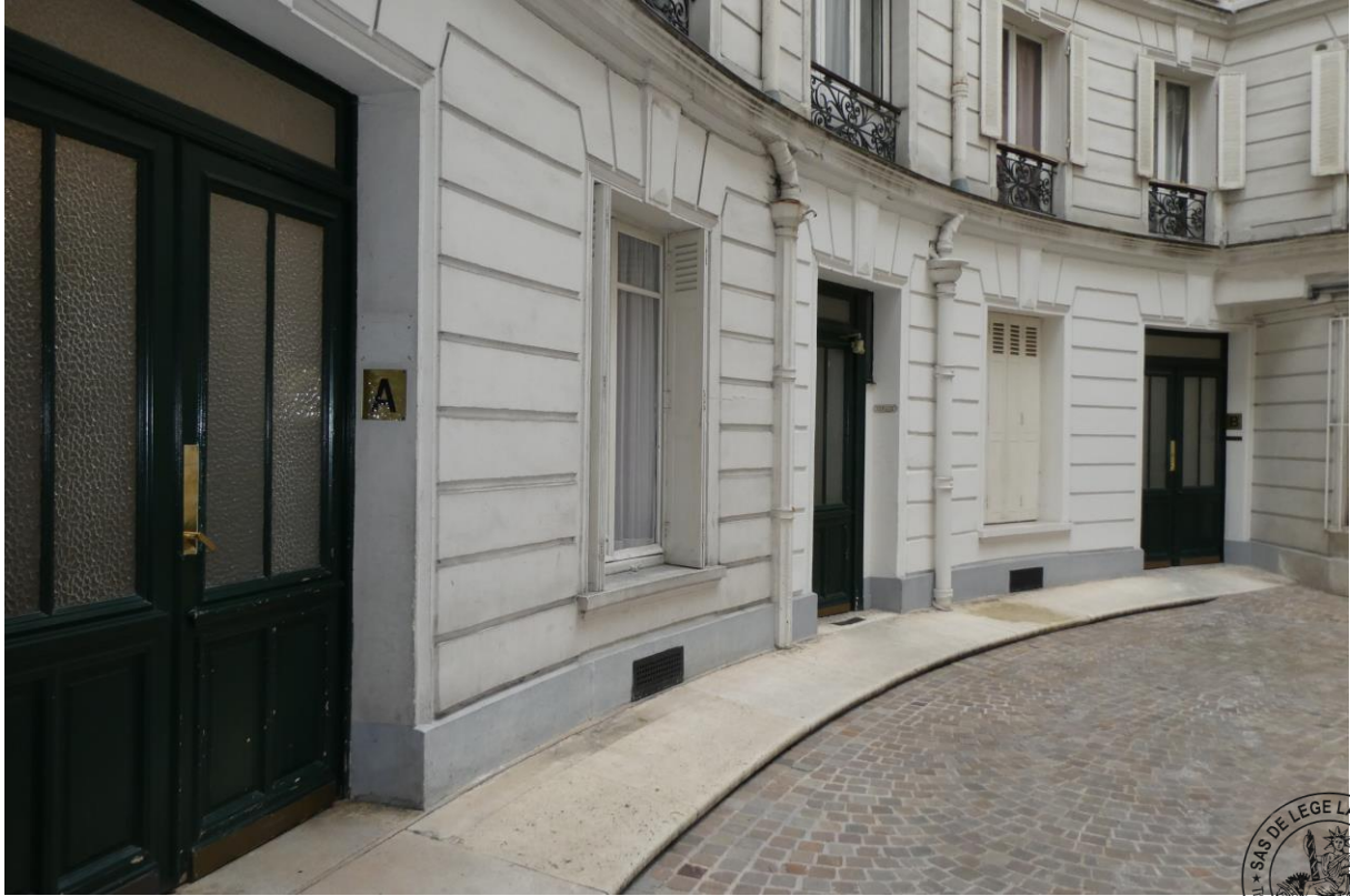
3 Bâtiment A dans la cour intérieure